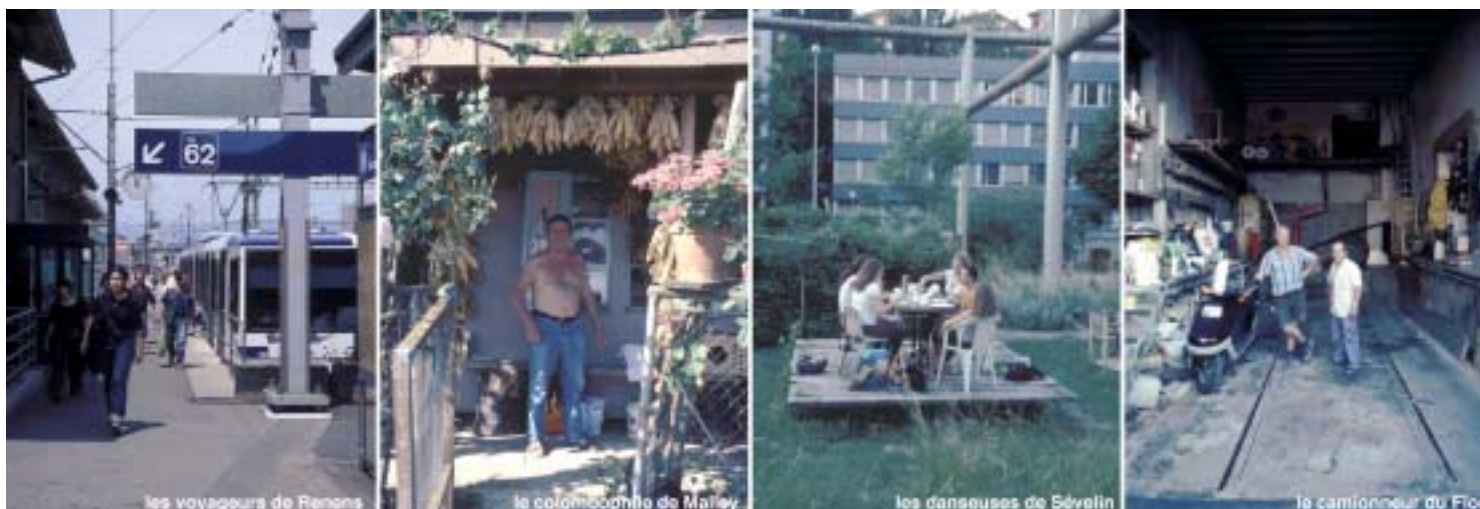
les voyageurs de Renens